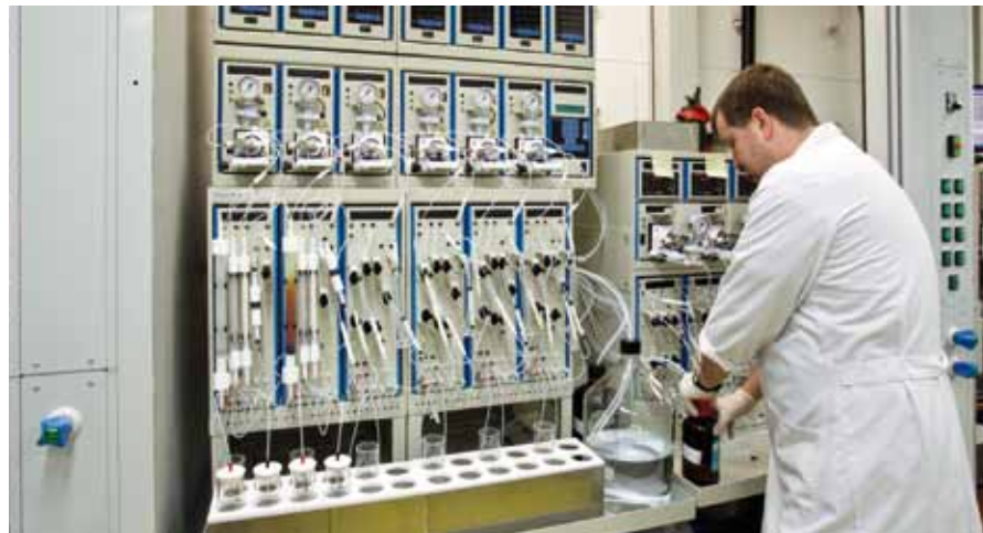
Opstelling voor de zuivering van dioxinemonsters door middel van drie opeenvolgende kolommen. Op de tweede serie kolommen van links wordt net een monster van ei gezuiverd (rood is het vet van het ei).

Het resultaat van een dioxineanalyse op het RIKILT-laboratorium is niet alleen een totaalconcentratie aan dioxines, maar ook een overzicht van