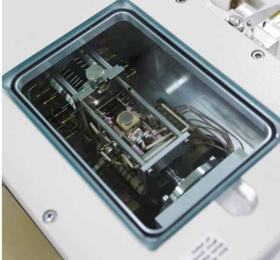
Ionisatie-element van de HR-MS.

\mu l en moesten we goed oppassen dat we die laatste druppel niet ook verdampen. Nu dampen we monsters volledig automatisch in tot een volume van een halve milliliter.” Op dit moment werkt Traag samen met een Amerikaans bedrijf aan een nieuwe opstelling. Daarmee kan hij zelfs de complete extractie en opzuivering volledig automatisch laten verlopen. “Het apparaat om tussentijds het oplosmiddel te verwisselen is zelfs speciaal voor ons ontwikkeld”, vertelt Traag trots. Innovatie aan de kant van de analyse is op dit moment nog te hoog gegrepen. “Het zou mooi zijn als er alternatieven beschikbaar zouden komen